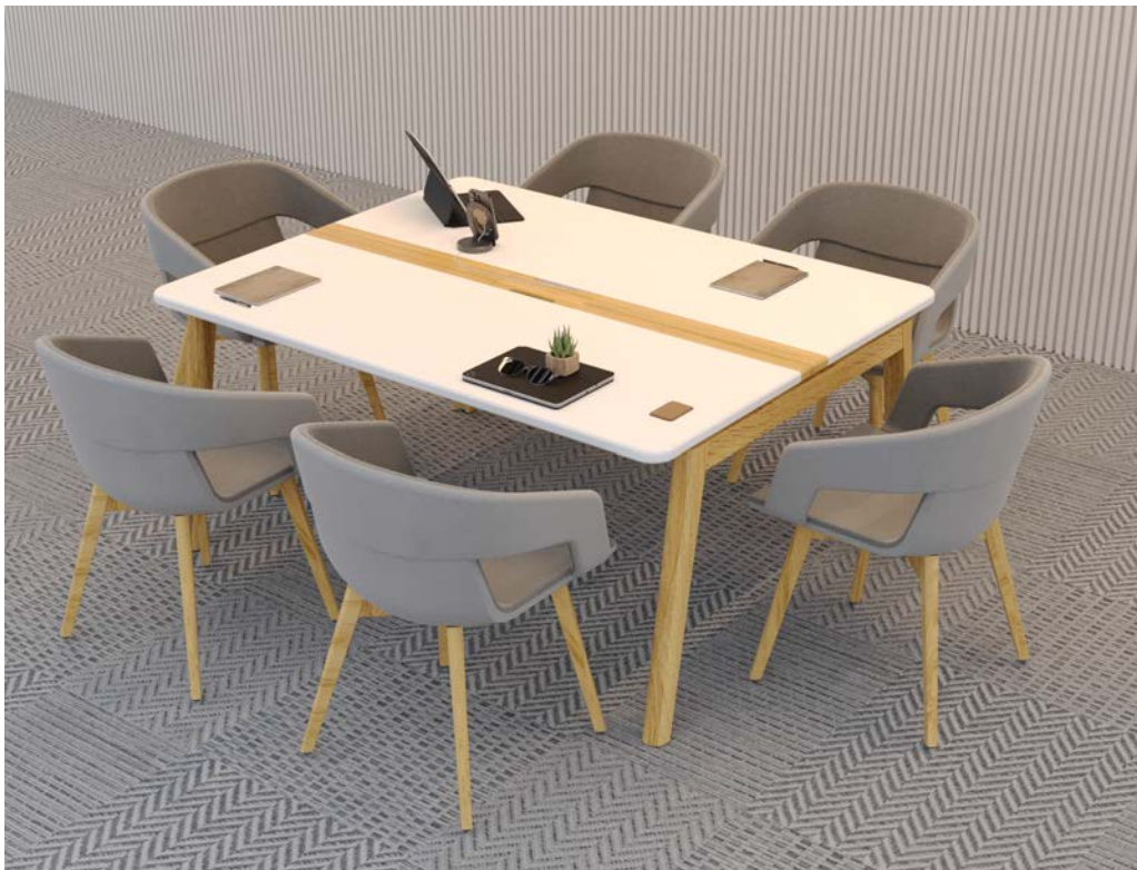
Table de réunion SEYCHELLES